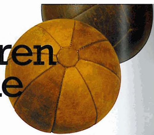
BALLSPIEL Super Deko: alte Medizinbälle. Über Freundts, ab 40 Euro.

Alt, nicht oll: Möbel mit Patina sind so begehrt wie nie – und heißen jetzt Vintage