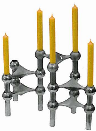
STECKLING Fifties-Kerzenhalter zum Zusammenstecken. Über Jetlag, 45 Euro.