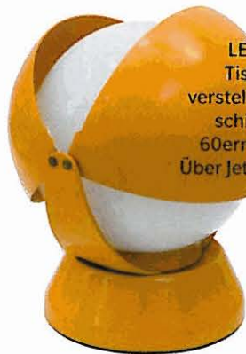
LEUCHTBOMBE Tischleuchte mit verstellbaren Metallschirmen aus den 60ern von Stilnovo. Über Jetlag, 145 Euro.