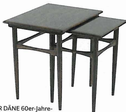
ALTER DÄNE 60er-Jahre-Satteltisch aus Mahagoni. Über Jetlag, 140 Euro.

„Vintage“ = Antikes der Dreißiger- bis Siebzigerjahre