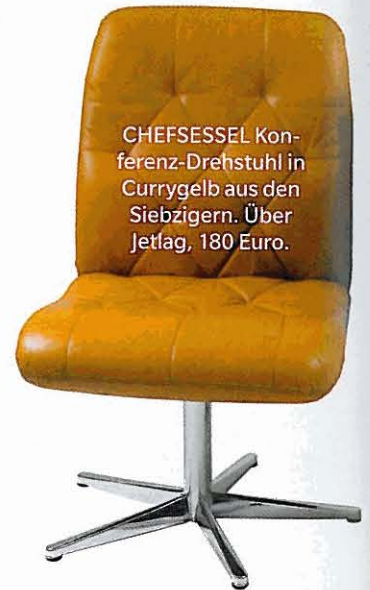
CHEFSESSEL Konferenz-Drehstuhl in Currygelb aus den Siebzigern. Über Jetlag, 180 Euro.

„Vintage“ = Antikes der Dreißiger- bis Siebzigerjahre